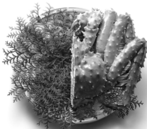
1杯8,400円の本タラバガニ0.5杯分(4,200円相当)

とっっても高い本タラバガニのように、今まで手が届きにくかったホームセキュリティ。 新登場のホームセキュリティ7(セブン)なら、月々たったの4,200円*から、 あなたの大切なご家族を365日・24時間お守りします。 北の味覚を堪能する前に、まずはALSOK総合警備保障までお電話ください。 *マンション2LDK(シントラルプラン)の料金を例